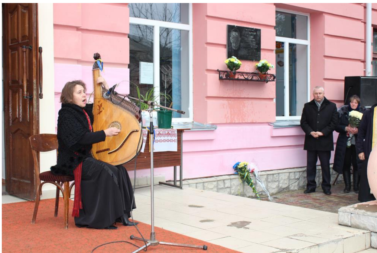
Відкриття меморіальної дошки