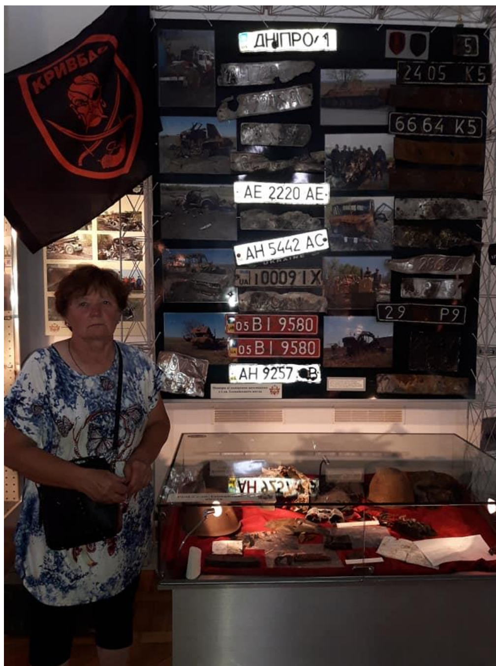
Здолбунівський музей . Зала воїнів АТО.