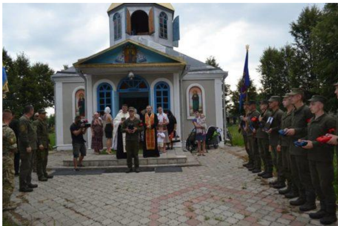
Дозахоронення капсули з частиною останків бійця 2018 рік