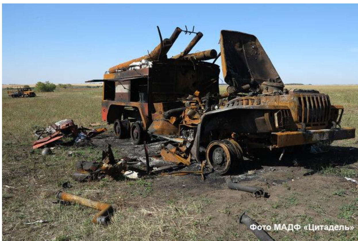
Іловайськ. Пожежна машина