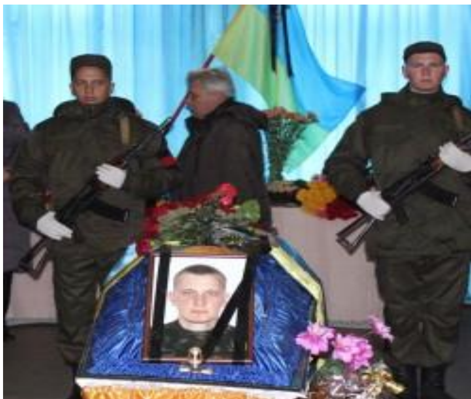
Поховання 2015 рік