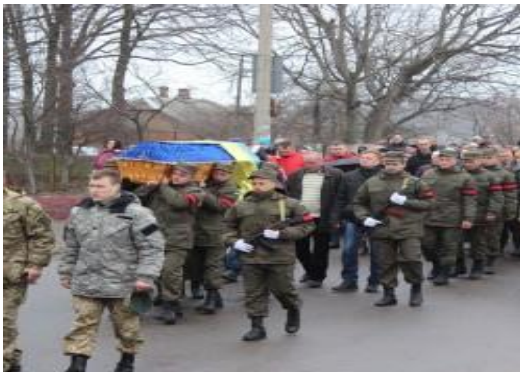
Поховання 2015 рік