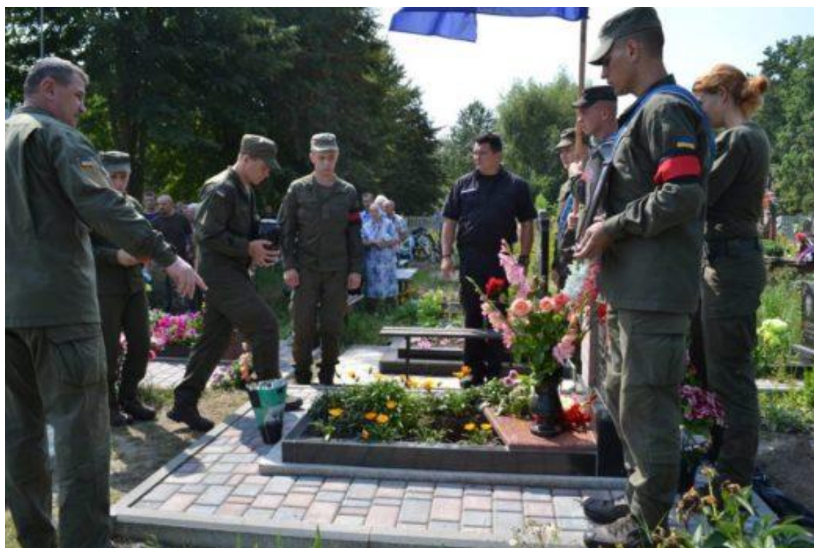
Дозахоронення капсули з частиною останків бійця 2018